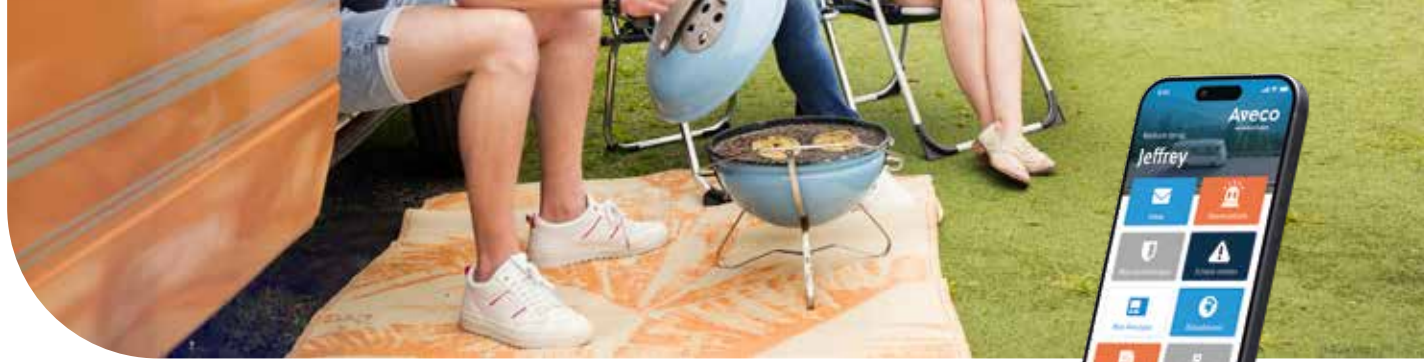
Aveco reist met je mee

We werken persoonlijk én met grote liefde voor kamperen. Onze mensen zijn echte kampeerliefhebbers. Je krijgt dus altijd een betrokken specialist aan de lijn die jouw caravan kent. Dit helpt je om de beste keuzes te maken voor jouw caravanverzekering.